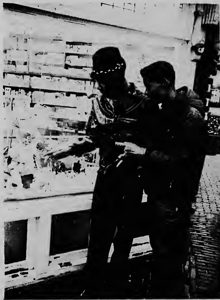
E showcasenan di e tiendanan di Naarden pronto a hala atencion di e Antillanonan.

nan. Un otro punto tambe ta cu for di awor algun trahador Antillano por cuminsa tuma experiencia. Pa un tal sindicato mundial manera Balamundi, un di e islanan Antillano por bira e